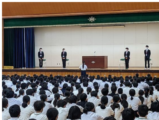
教育実習生あいさつ