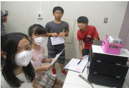
6年生冒頭のあいさつ