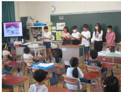
6年生の発表の様子(1年生)