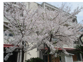
正門横のソメイヨシノ

4月9日(火)、朝から雨模様の天気でしたが、たくさんの保護者のみなさん、来賓のみなさん、教職員が見守るなか「令和6年度入学式」を行いました。今年度は新入学児童109名を迎え、有岡小学校全校児童692名でスタートします。新1年生の保護者のみなさま、ご入学おめでとうございます。これからも、有岡小学校にご支援・ご協力をよろしくお願い申し上げます。