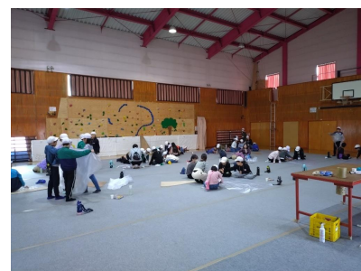
気球づくり(体育館)