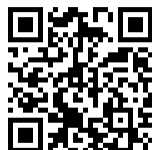
笹小だより QRコード