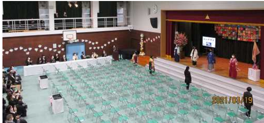
← ステージから4人そろって入場です

3月19日、好天のもと全員そろって見事に卒業しました。みんないつも以上に緊張していましたが、凜とした態度で立派に卒業証書を受け取っていました。式場は5年生が前日に美しく仕上げ、お祝いの心とともに中学校へ送り出すことが出来ました。卒業証書を授与するときに、一人一人に対して「おめでとう」や「〇〇頑張った」など声をかけていたのですが、実に素直な感じで「ありがとうございます」と答えてくれる声がとても嬉しかったです。全校生の皆さんに、6年生が巣立っていった様子を少し写真で紹介します。