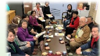
学校応援団「笹ポーター」