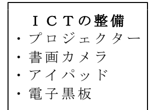
I C T の整備 ・プロジェクター ・書画カメラ ・アイパッド ・電子黒板