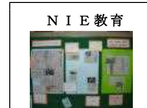
N I E 教育