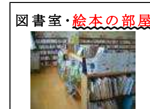
図書室・ 絵本の部屋