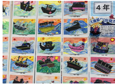
4年生 「大海原に 出発だ」 「世界にひとつ だけの花」