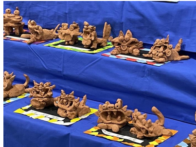
5年生 「紹介したいお 気に入りの和」 「我が家を守る シーサー」