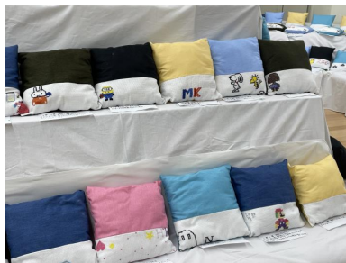
6年生 「世界に 1つだけの クッション」