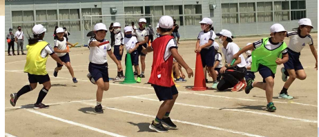
4年生表現「チャレンジ！～心をひとつに～」