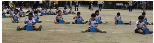
6年生表現「This is Me～感動をチカラにかえて～」