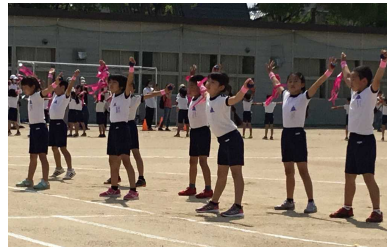
3年生表現「オー！リバル」