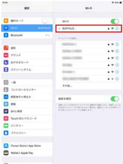
1. Wi-Fi ネットワークに接続されます

接続している Wi-Fi ネットワークには"チェックマーク"が表示されます。また、iPad の画面上部のステータスバーに Wi-Fi 接続アイコンが表示されます。