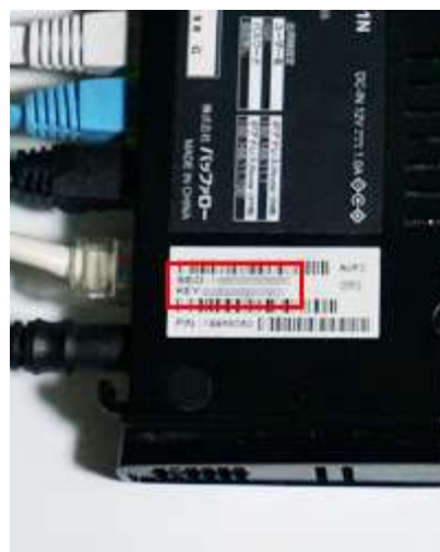
本体に記載されているパスワードを確認します