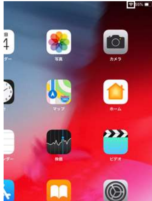
2. Wi-Fi 接続中は接続アイコンが表示されます