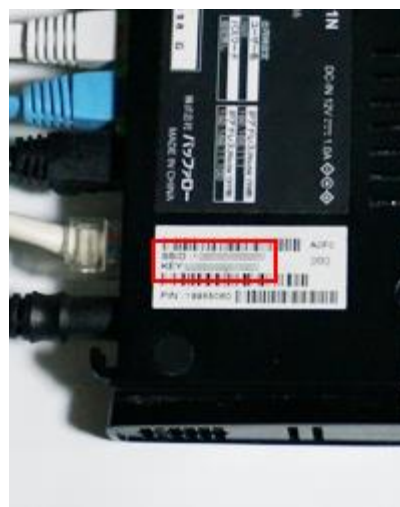
本体に記載されているパスワードを確認します