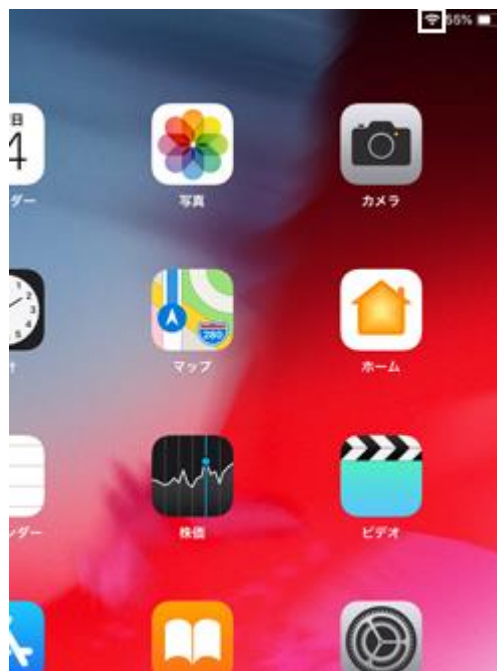
2. Wi-Fi 接続中は接続アイコンが表示されます