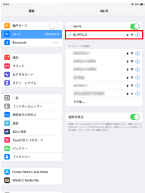
1. Wi-Fi ネットワークに接続されます

接続している Wi-Fi ネットワークには"チェックマーク"が表示されます。また、iPad の画面上部のステータスバーに Wi-Fi 接続アイコンが表示されます。