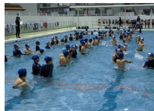
水泳学習のはじまり(3年生)