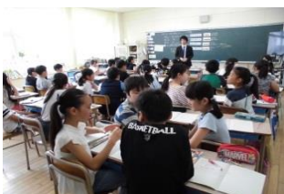
参観日の授業風景(5年生)