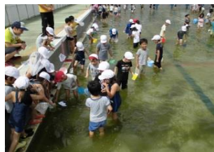
プールでやごとり(2年生)