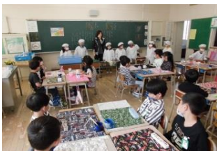
はじめての給食(1年生)