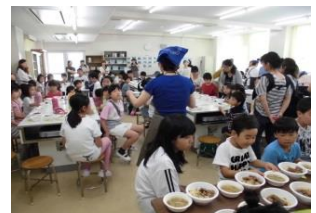
グジョウ博士の出張授業(サタ)