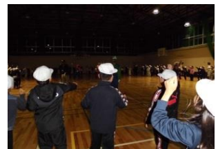
転地学習キャントゥルファイヤー(4年生)