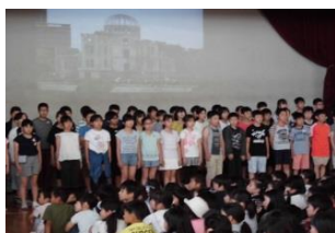
平和集会でのメッセージ(6年生)