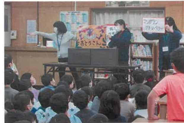
ピッピ(図書) 業間休み～読み聞かせ～