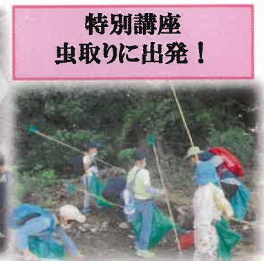
特別講座 虫取りに出発！