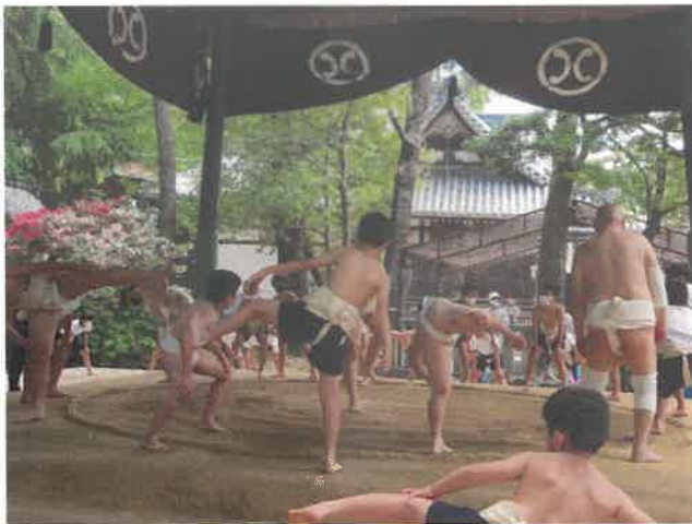
土曜学習 ～相撲に挑戦！～