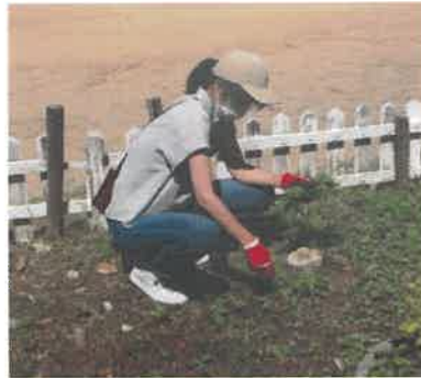
庭夢(園芸) 花壇の手入れ

学校・家庭・地域が連携、 協働して子どもの学びや育ち を支える活動をしています。