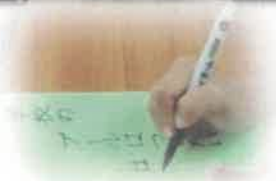
150周年 花の俳句大会