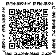
伊丹小学校ナビ 伊丹小学校ナビ 伊丹小学校ナビ 伊丹小学校ナビ 伊丹小学校ナビ 伊丹小学校ナビ 伊丹小学校ナビ 伊丹小学校ナビ 伊丹小学校ナビ 伊丹小学校ナビ

改めてご案内します。伊丹小学校のきまり等をコンパクトにまとめています。ぜひ、ご覧ください。※本校 HP 学校の紹介→学校ガイドブックにも掲載しています。