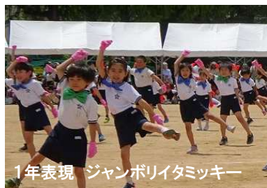
1年表現 ジャンボリイタミッキー

昨年まではズームでの観戦だったので、この臨場感も迫力も感じ難かったことと思います。6年生が運動会のスムーズな運営のためにきびきびと働く姿もしっかり見ることができたと思います。伊丹小学校の伝統としてつながっていくことと嬉しく思いました。