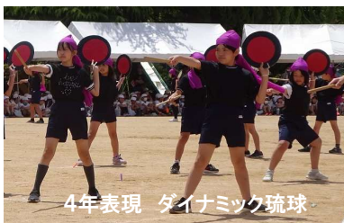
4年表現 ダイナミック琉球