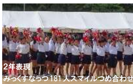
2年表現 みくくすなつつ181人スマイルつめ合わせ