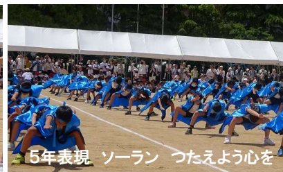
5年表現 ソーラン つたえよう心を