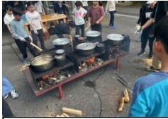
野外炊事:カレー作り