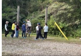
HAP:力を合わせて課題をクリア

予定した活動はすべて行うことができました。直前まで大雨で、キャンドルファイヤーに変更するか迷ったキャンプファイヤーでしたが、予定時刻には雨も上がり、ファイヤーを囲んで楽しい時間を過ごすことができました。これから、自然学校についてまとめ、伝える学習活動を行います。