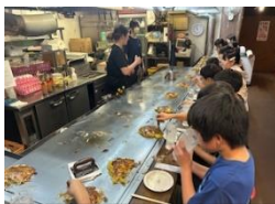
1日目の昼食はお好み焼き

10月23日、24日、6年生191人全員が参加して広島に修学旅行に行ってきました。1学期から戦争や平和について学んできた6年生、自分の目と耳、からだで心で感じ、学び、平和への思いを強くしたのではないのでしょうか。