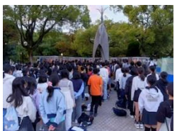
平和セレモニー 伊丹っ子みんなで作った折り鶴を捧げました。

広島駅からは、路面電車に乗って原爆ドームのある平和記念公園へ行き、資料館の見学や碑めぐりをしました。原爆が広島に落とされたとき9歳だったという証言者の方の貴重なお話も聞かせていただきました。2日目は、フェリーで宮島に渡り、お買い物を楽しみました。