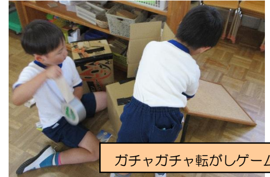
ガチャガチャ転がしゲーム