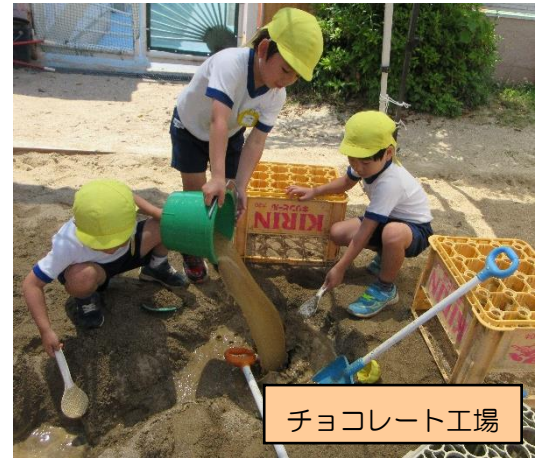
チョコレート工場