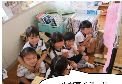
火が高くなった・・・