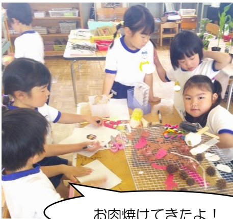
お肉焼けてきたよ！