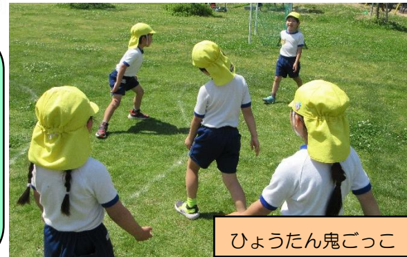
ひょうたん鬼ごっこ