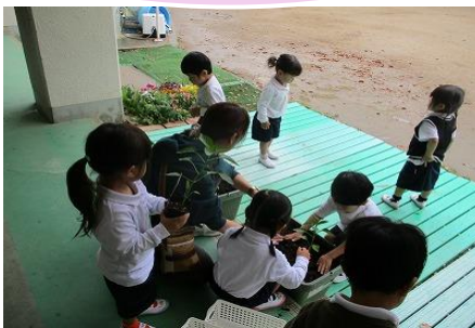
ピーマンとサツマイモを 植えました！

少しずつ幼稚園での生活や身の回りのことに親しみながら、自分で身支度をやってみようしたり、身支度を終わると好きな遊びを楽しみにしたりする様子が見られるようになってきました。戸外や室内で十分に好きな遊びを楽しみ、安心して過ごす姿が見られます。また、絵本や手遊び等、少しずつクラスで先生や友達と過ごすことを楽しみにするようになってきました。明日の参観日では、室内で好きな遊びを見つけて安心して遊びを楽しんでいる姿を見つけていただくと嬉しいです。