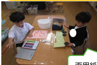
画用紙で車ができたよ！

室内遊びでは、画用紙を貼り合わせたり、絵を描いたりすることを楽しみだしています。また、ままごとでは、いろいろなごちそうを作ったり、食べたりしながら繰り返し楽しんでいます。戸外で興味関心をもち始めているダンゴムシ等の生き物を見たり、触れたりできるよう、室内にも生き物とかわかるコーナーを準備し、子ども達は不思議さやおもしろさを感じています。