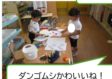
ダンゴムシかわいいね！