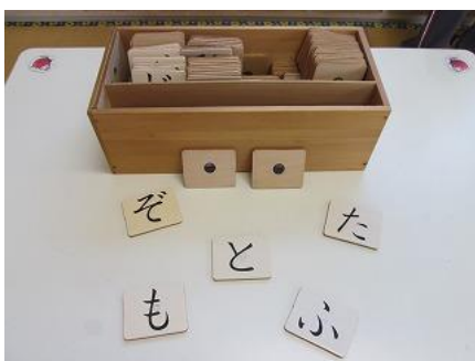
110 ひらがなカード (磁石つき)