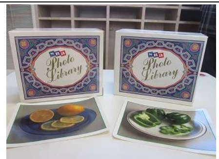
112 言語療法訓練写真 カードⅠⅡⅢ