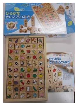
111 ひらがなさいころ つみき