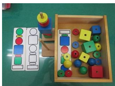
408 色と形合わせセット