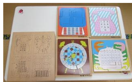
403 なんだろうパズル