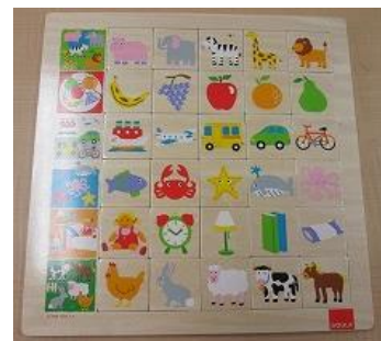
406 なかよしグループ