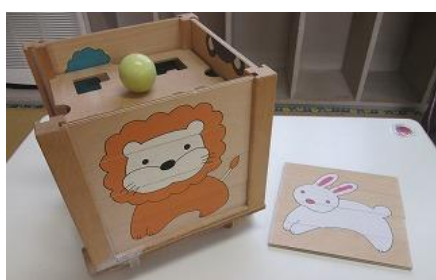
404 型はめボックス 絵合わせパズル