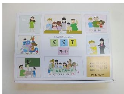
601 SST カード