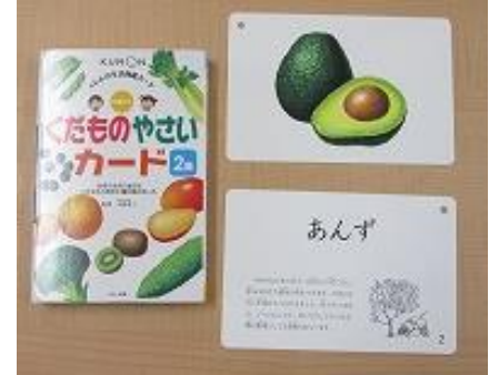
103 くだものやさいカード2