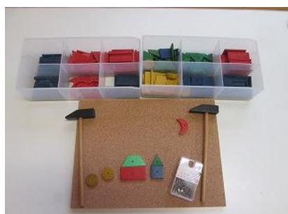
407 色と形の学習 コルクボード A (図形)