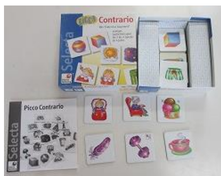
504 Picco Contrario 記憶力を応用