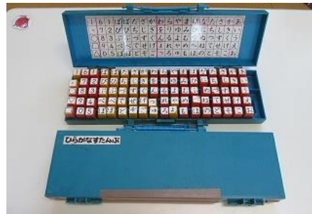
108 ひらがなスタンプ