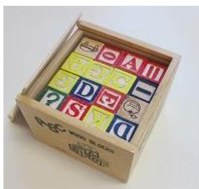
802 ABC ウッドブロック