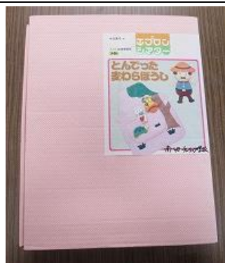
702 エプロンシアター (とんでったまわら帽子)