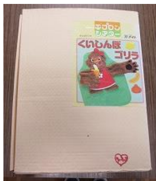
701 エプロンシアター (くいしんぼゴリラ)