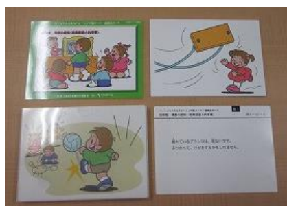
602 SST カード