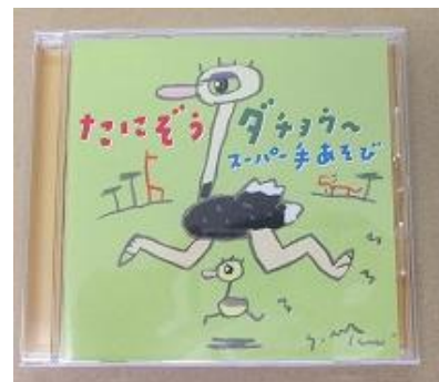
703 たにぞうダチョウ スーパー手遊びCD)