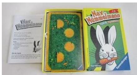
501 マイティーマックス