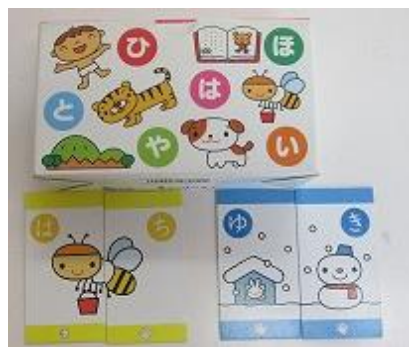
502 絵合わせマッチング 短期記憶