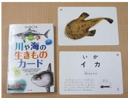
104 川や海の生きもの カード