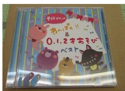
704 わんぱく! 0.1.2 オ あそびベスト (CD)