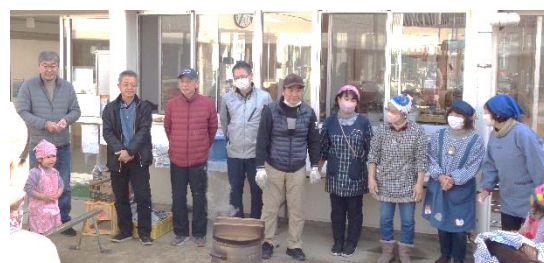
もちつきのご協力をありがとうございました。

○自転車置き場や、駐車場でのご置き引きに十分にお気をつけください。短時間であっても、自転車のカゴや車内に貴重品を置いたままにしないようにしましょう。