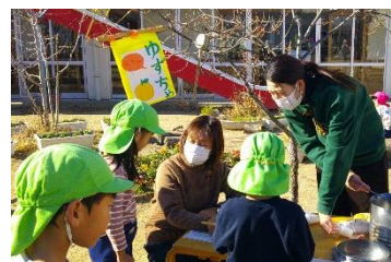
冬至 ゆず茶屋さんが 園庭にできました。